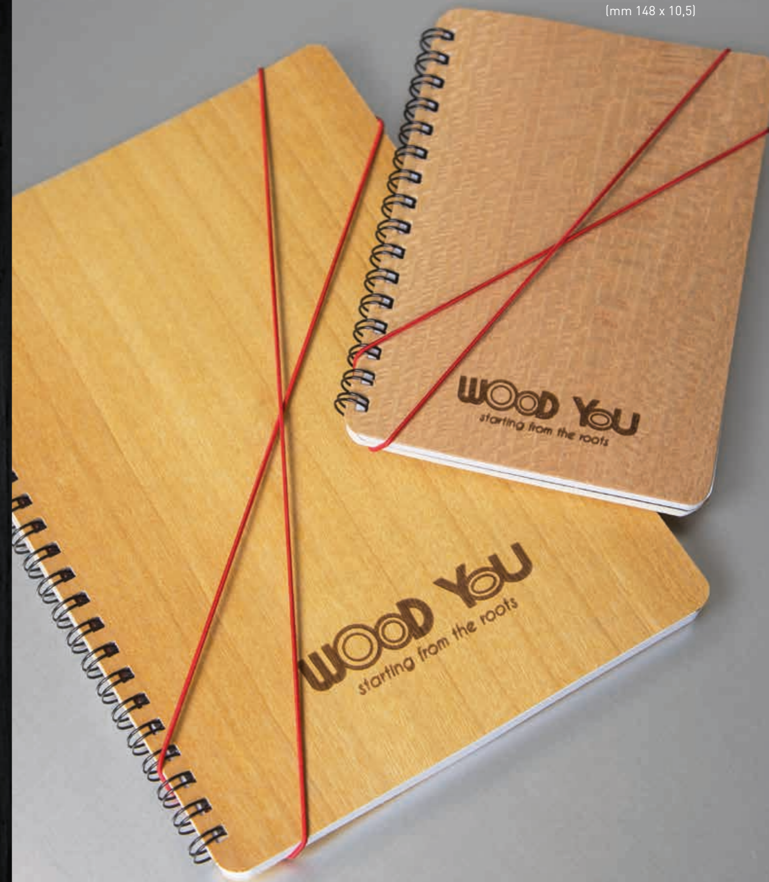
Formato: A/5 (mm 210 x 148)